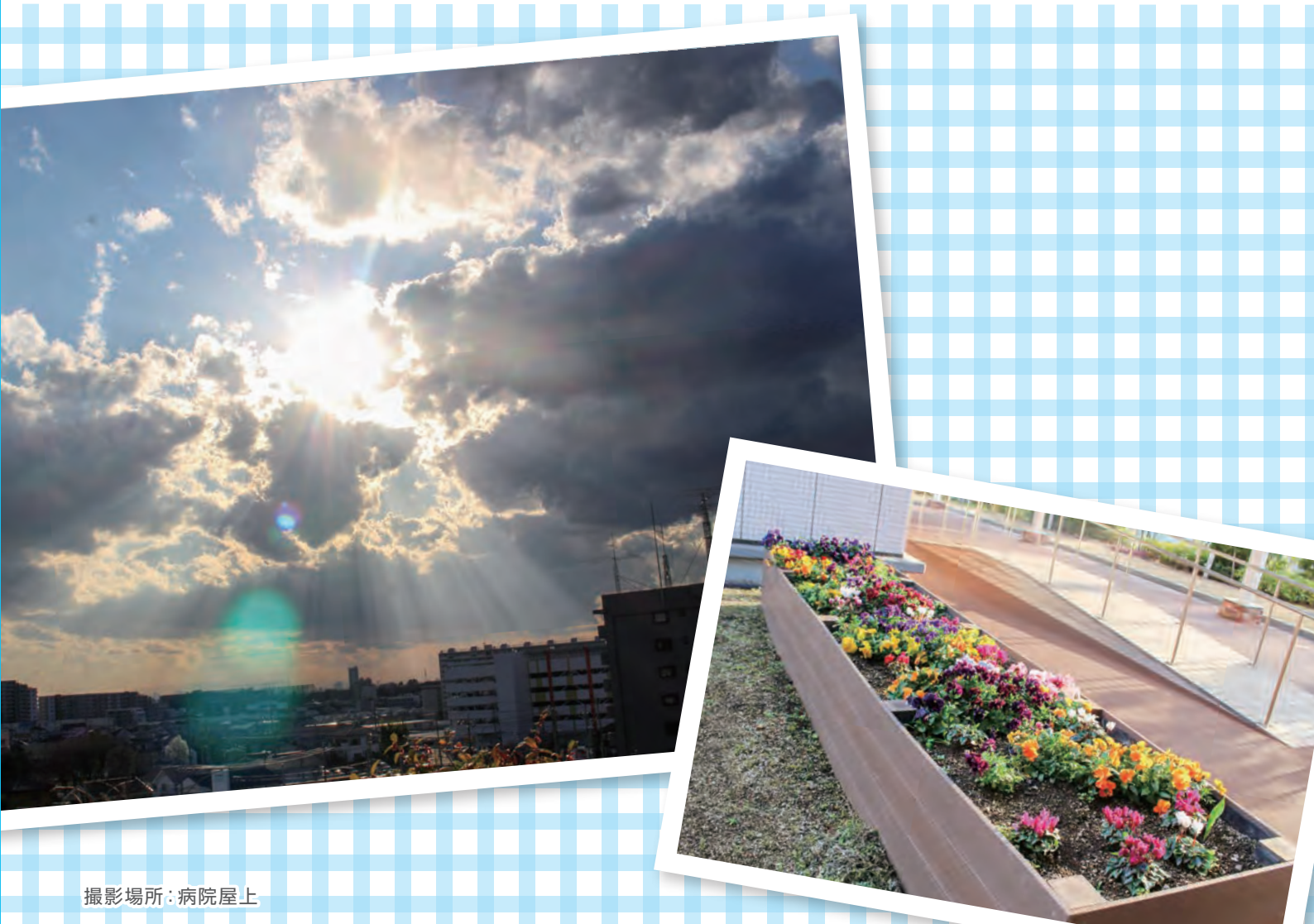
撮影場所：病院屋上