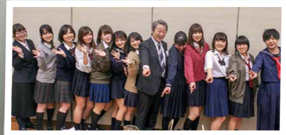
一般社団法人 巨樹の会 千葉3病院合同忘年会