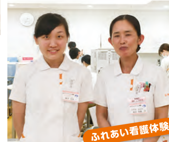
ふれあい看護体験

7月、千葉県看護協会主催の「ふれあい看護体験」と、看護学生を対象とした「インターンシップ」を開催しました。当日は、当院の看護師と一緒に看護体験を行うことで、短い時間ではありましたが「リハビリテーション看護」を知っていただくことができました。