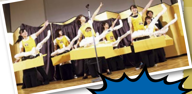
千葉みなとリハビリ余興 「千葉みなスタイル」