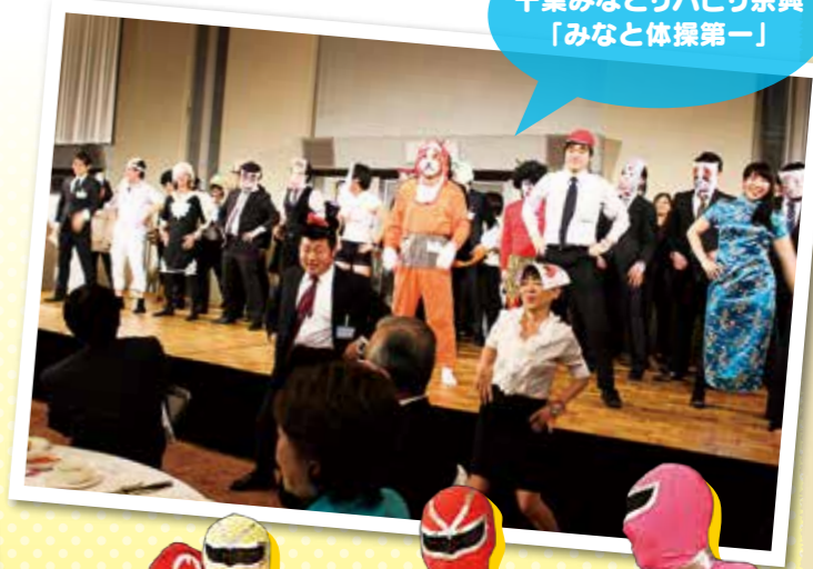
千葉みなとリハビリ余興 「みなと体操第一」