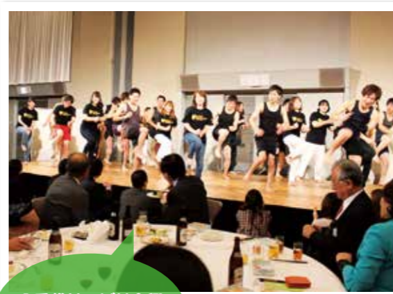
八千代リハビリ余興 「八千代ドッピズバー」

連病院の職員、総勢500名近い盛大な会となりました。なかでも余興は各病院対抗で披露され、3病院とも練習の成果を発揮し、大いに盛り上がりました。 また、大抽選会も行い、大変有意義に過ごすことが出来ました。本年度も更に団結力が高まった千葉巨樹の会を宜しくお願い致します。